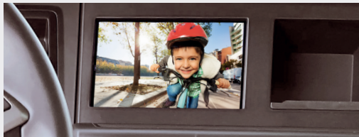
MAN Mediasystem Navigation Advanced 7 Zoll

Plug & Play Adaptionen an MAN Mediasystem Advanced & Professional zum Anschluss von AXION Kameras