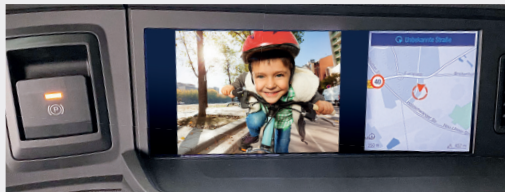
MAN Mediasystem Navigation Professional 12,3 Zoll